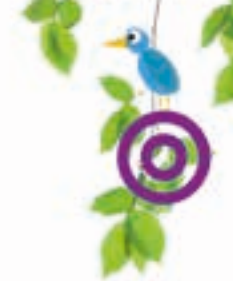
SCHÉMA DE PLANTATION

Mesurez la longueur de votre future haie. Là, décidez si vous souhaitez planter une ou deux lignes d'arbustes.